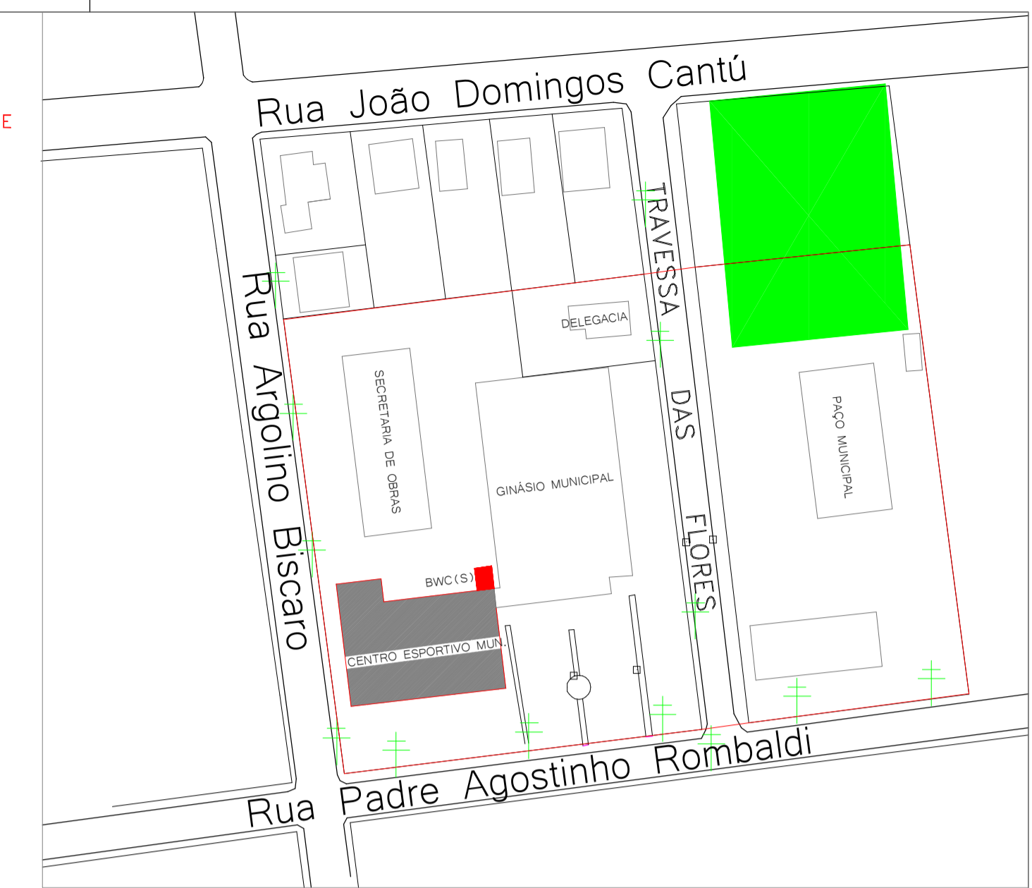
LOCALIZAÇÃO ESC.: 1/250