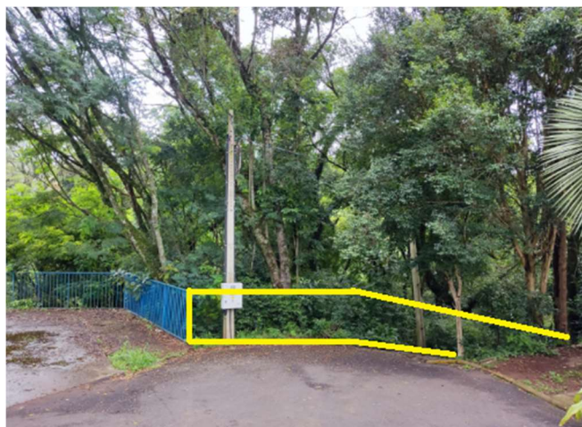
GUARDA CORPO LATERAL (Guarda-corpo em Madeira Plástica)