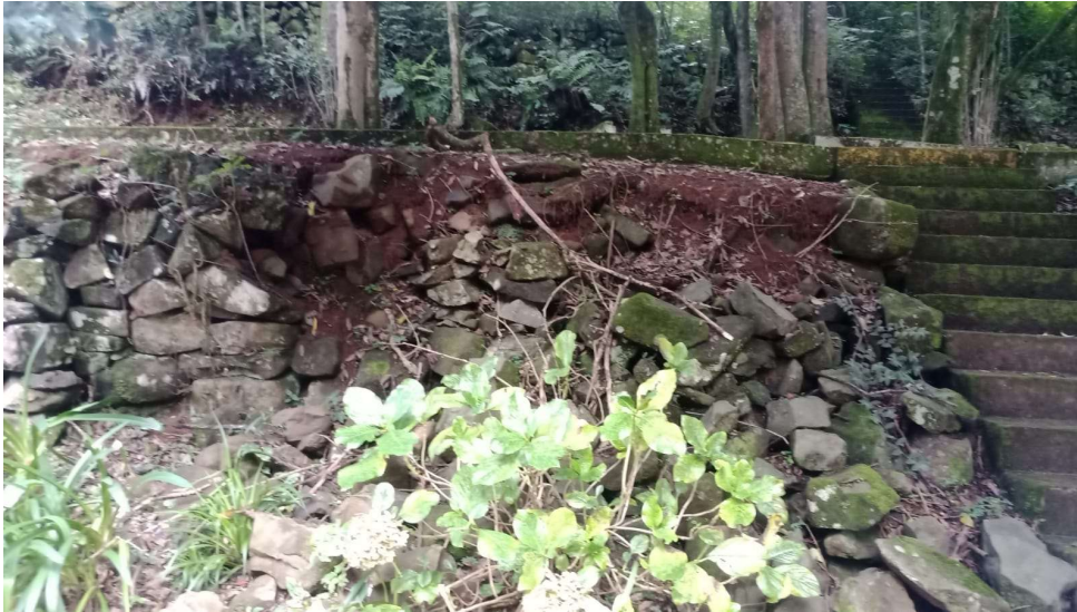
MURO DE CONTENÇÃO (NOVO) (Conserto Pedras Taipa c/ argamassa + Muro Contenção)