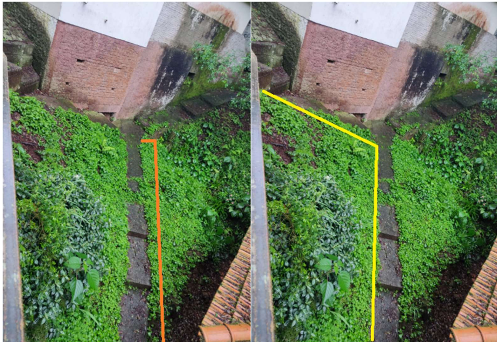
CALÇADA/ESCADA CASA MÁQUINAS (ALARGAMENTO 60cm) (Limpeza + Pintura + Alargamento) (Escada Concreto Armado c/ + L= 60cm) (Acessibilidade c/ Guarda-corpo)