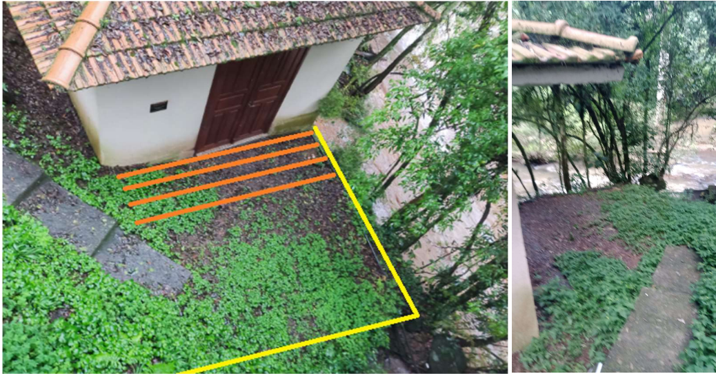
DECK EM MADEIRA 3,60 X 2,58/GUARDA-CORPO 3,60 X 2,20 DECK MADEIRA/FUNDAÇÃO DECK MADEIRA (AO LADO CASA MÁQUINAS) (Sapatas + Pilares Tubos Concreto D=30cm) (Guarda-corpo/corrimão lado esquerdo) (Vigas Concreto 15 x 30cm + Barrotes Madeira 6x16cm) + (Revest. Régua de Madeira Plástica)