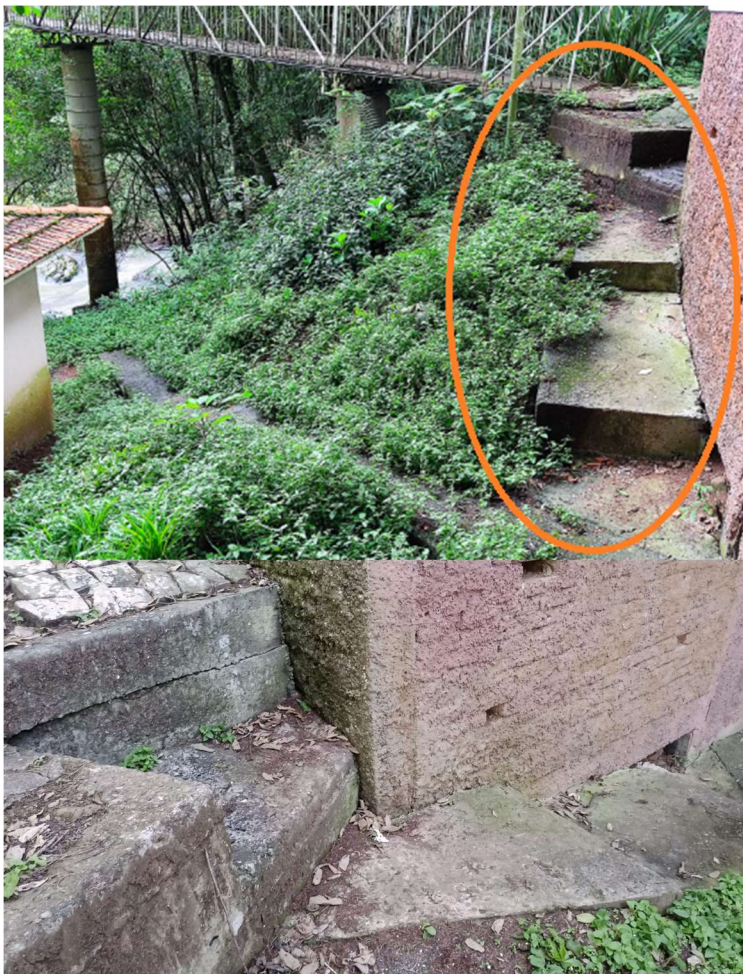
ADEQUAÇÃO DEGRAUS ACESSOS DIVERSOS (Guarda-corpo/corrimão lado esquerdo) (Ajuste tamanho dos degraus/espelho)