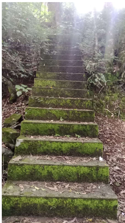
ESCADAS (Demolição c/ Rompedor)