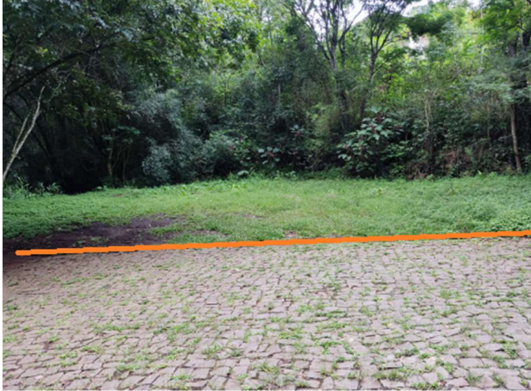
PAVIMENTAÇÃO E ACABAMENTOS (Construção de Mureta)