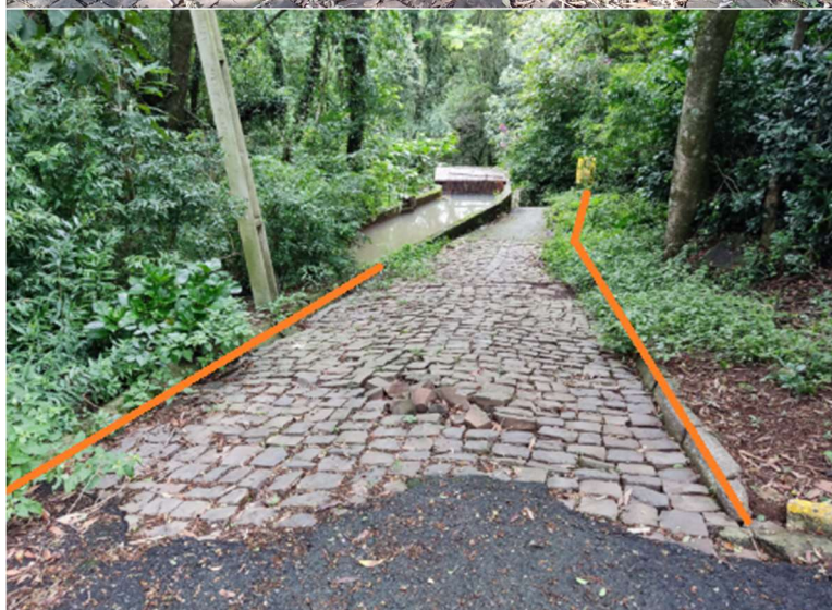
ACESSIBILIDADE GUARDA-CORPO ESCADAS/RAMPAS (100M) (Guarda-corpo/corrimão + Conserto Pedras Basálticas), (Ajuste dos meio-fios e troca)