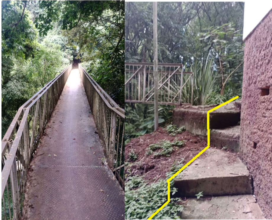
PINTURA PASSARELA METÁLICA (Lixamento + Pintura Alquídica) (Acessibilidade c/ Guarda-corpo)