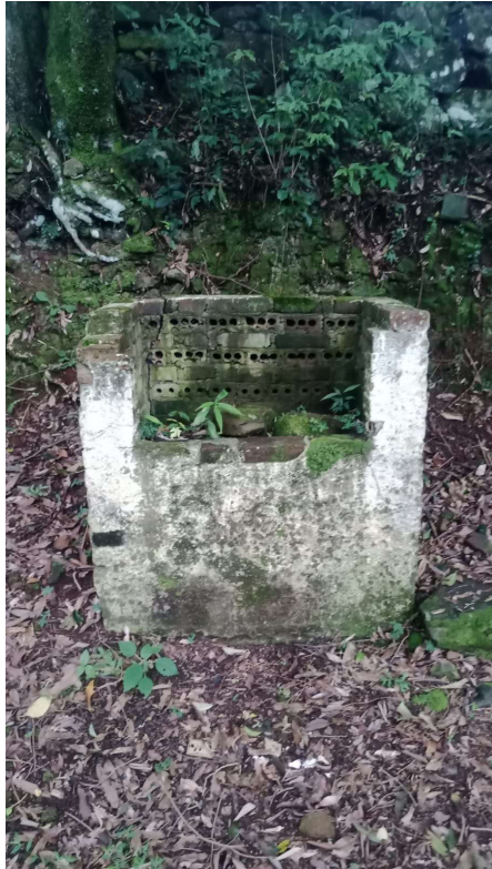
CHURRASQUEIRAS (X4) (Radier + Alvenaria Tijolos Cerâmicos) (Chapisco + Massa Única + Pintura) (Tijolos Refratários + Cano p/ espeto)