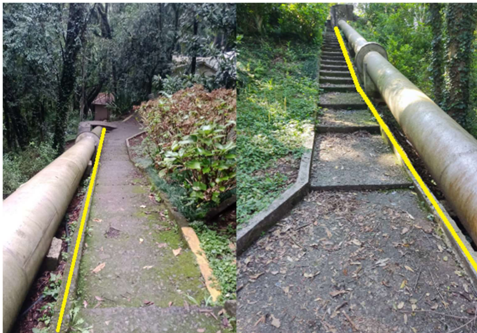
ACESSIBILIDADE GUARDA-CORPO (Guarda-corpo/corrimão um dos lados)