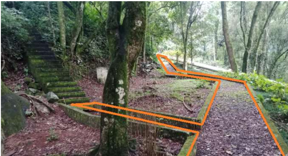
PAVIMENTAÇÃO COMPLETA/MURETAS PRAÇA (Preparo de Base + Radier Concreto) (Conserto de Muretas + Treliça Nervurada) (Preenchimento Canteiros c/ Pó-de-Pedra) (Pintura Acrílica Calçadas e Muretas)