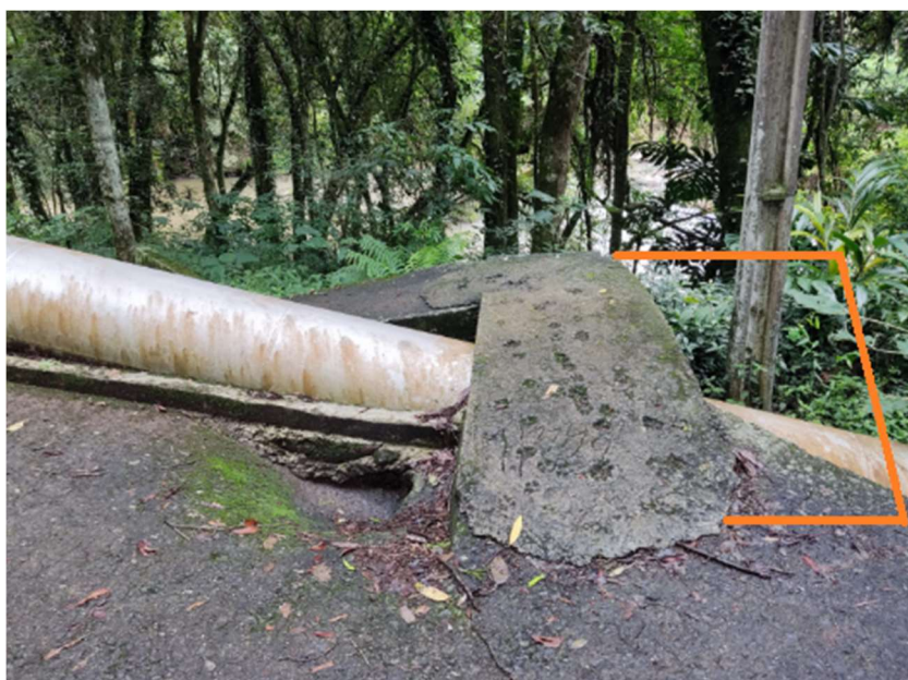
ALARGAMENTO RAMPA/ACESSIBILIDADE GUARDA-CORPO (Muro Bloco + Laje Maciça + Guarda-corpo/corrimão 2 lados) (Alargamento Rampa Existente + 60cm da base)