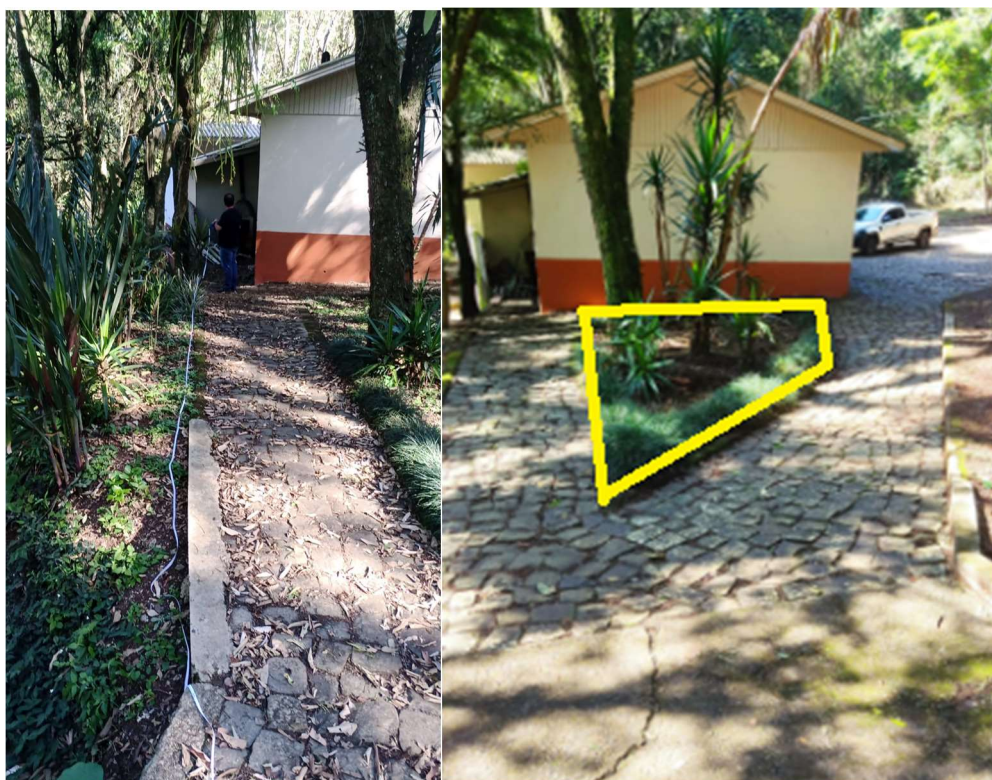
MURETA CANTEIRO CENTRAL ACESSO (Guarda-corpo/corrimão lado esquerdo) (Muretas de Concreto 15 x 15cm no Canteiro Central)