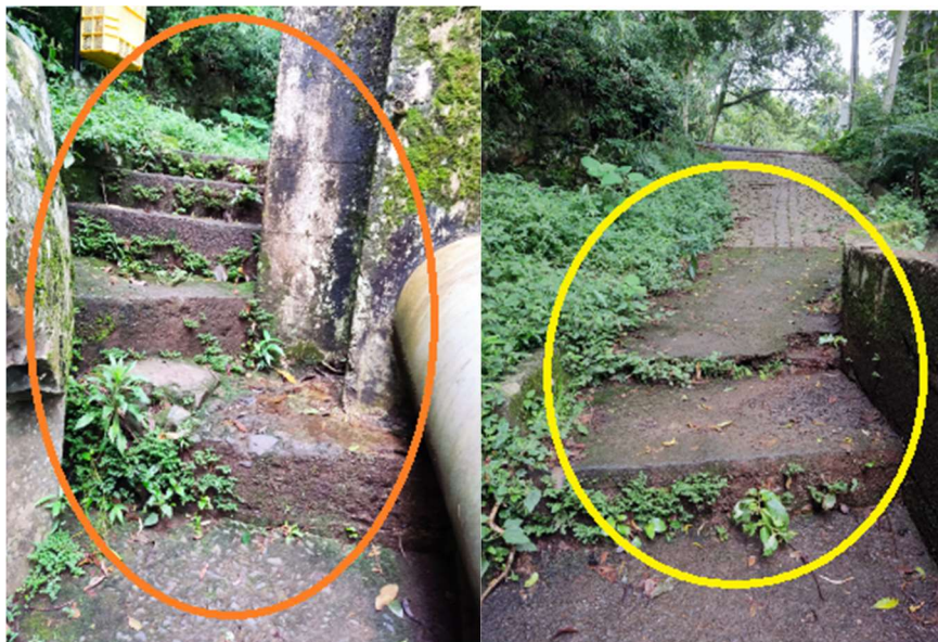
ADEQUAÇÃO DEGRAUS ACESSOS DIVERSOS (Ajuste tamanho dos degraus/espelho)