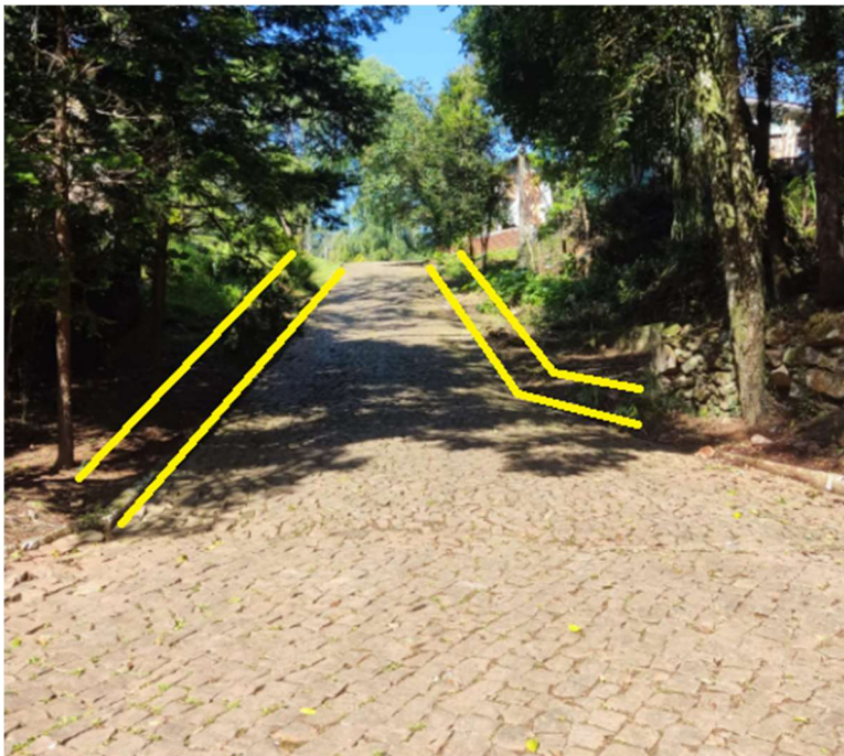
CONSERTO CALÇAMENTO ACESSO PARQUE + PASSEIO L=1,20M (Calçada em Concreto Armado L=1,20m nos 2 Lados da Rua) (Mureta + Treliça Nervurada H6, Aço 3,2mm, comprimento 6m)