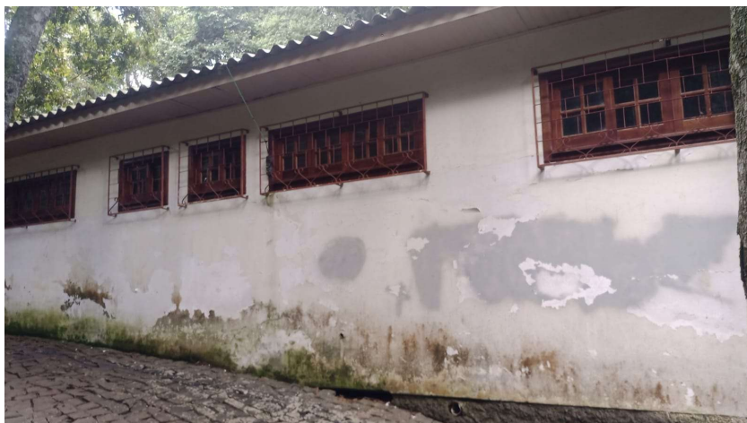
PINTURA EDIFICAÇÕES EXISTENTES (Pintura Acrílica + Esmalte Sintético Madeira Portas + Tinta Alquídica Grades) FORRO (Conserto Forro Beirais de Pinus + Roda-forro)