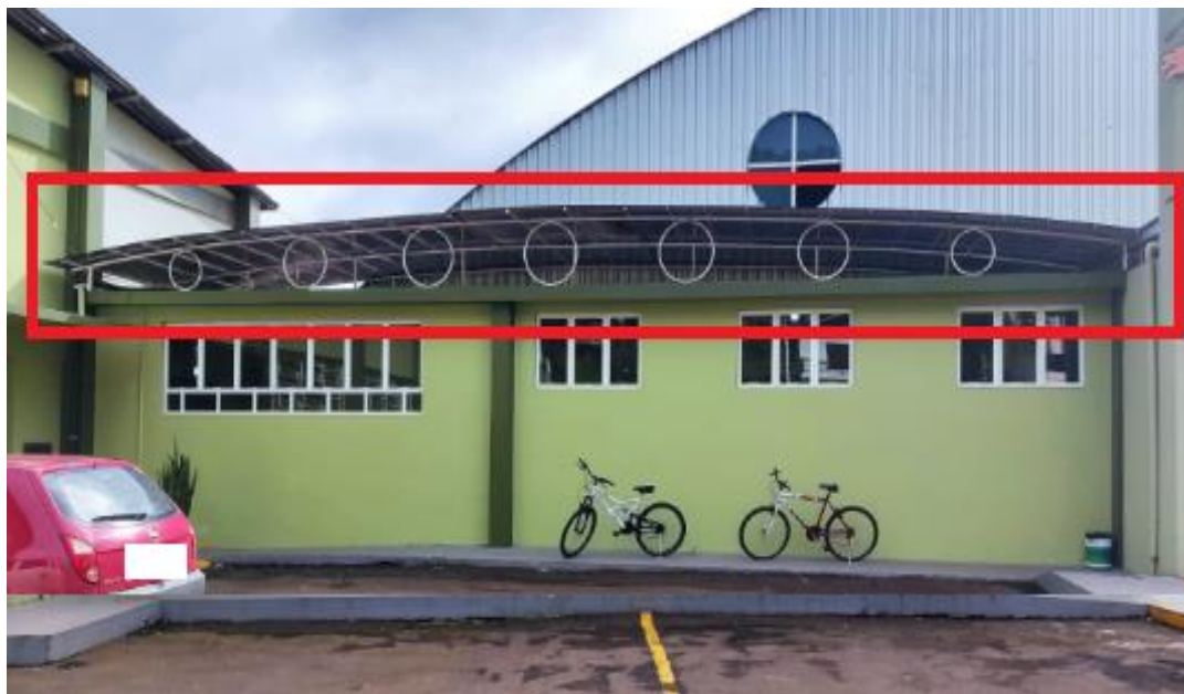
Foto 04: Lado Esquerdo da Cobertura