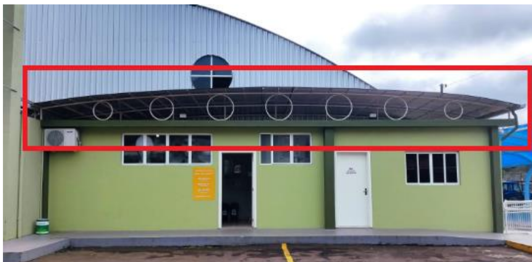
Foto 03: Lado direito da cobertura