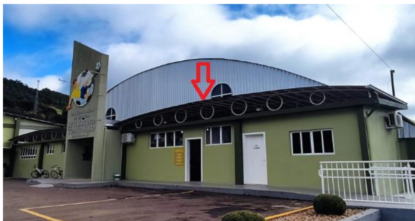
Foto 01 - Coberturas e vedações, a seta indica que aos fundos deverá ser realizada a vedação com rufos em toda estrutura onde interliga a cobertura com o fechamento do ginásio

Fixação através de parafusos com arruela de borracha.