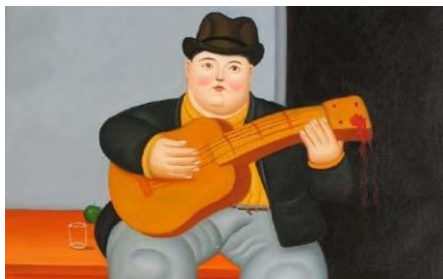
Obra: Homem com Guitarra