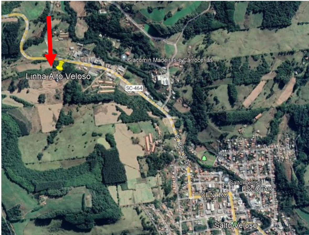
Fig. 1 – Imagem Google do local da perfuração do poço Linha Alto Veloso Coordenadas UTM – 458349m E – 7025012 S. Cota 912m.