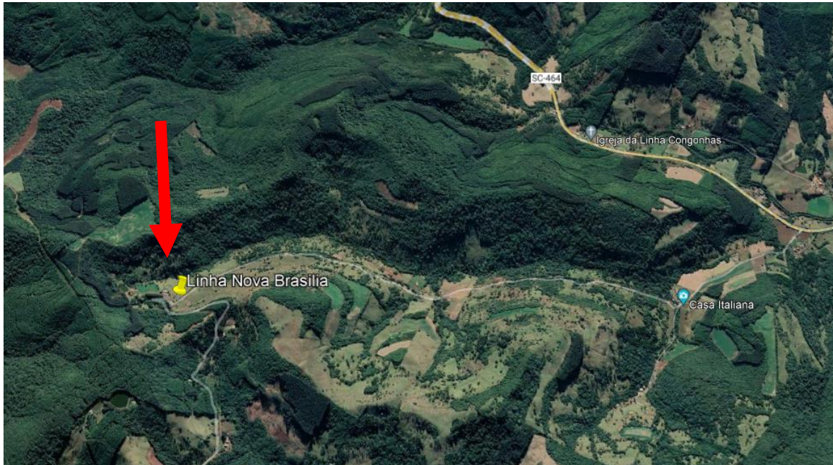
Fig. 1 – Imagem Google do local da perfuração do poço Linha Nova Brasília Coordenadas UTM – 452835m E – 7028685m S. Cota 1.160m.