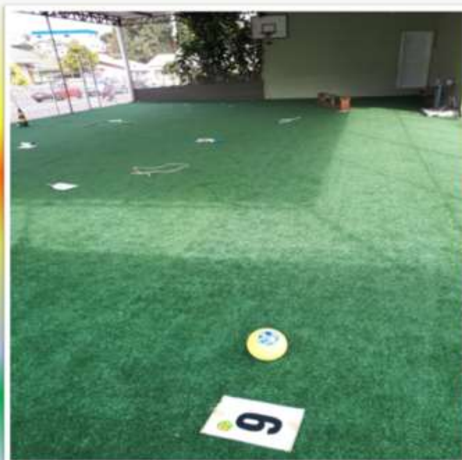
TROCA DA GRAMA SINTÉTICA QUADRINHA