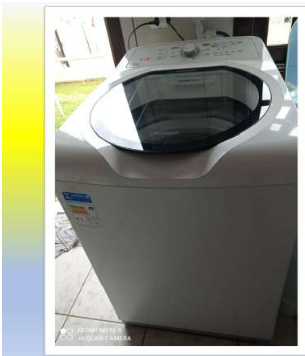
Máquina de lavar CMEI