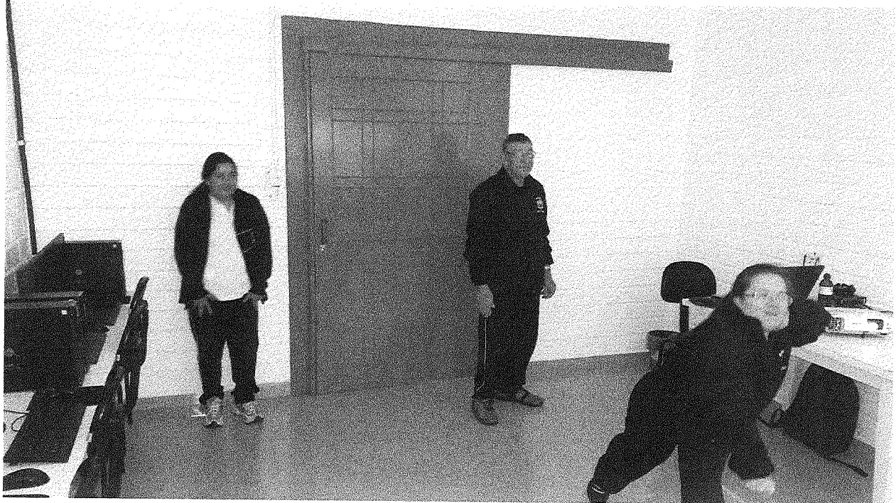
Jogo com Xbox e Kinect