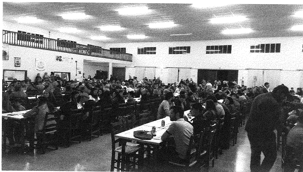
Visita a CASAN

Assinatura: [Handwritten Signature] Fls. 99 Sub: [Handwritten Signature] Salto Velo