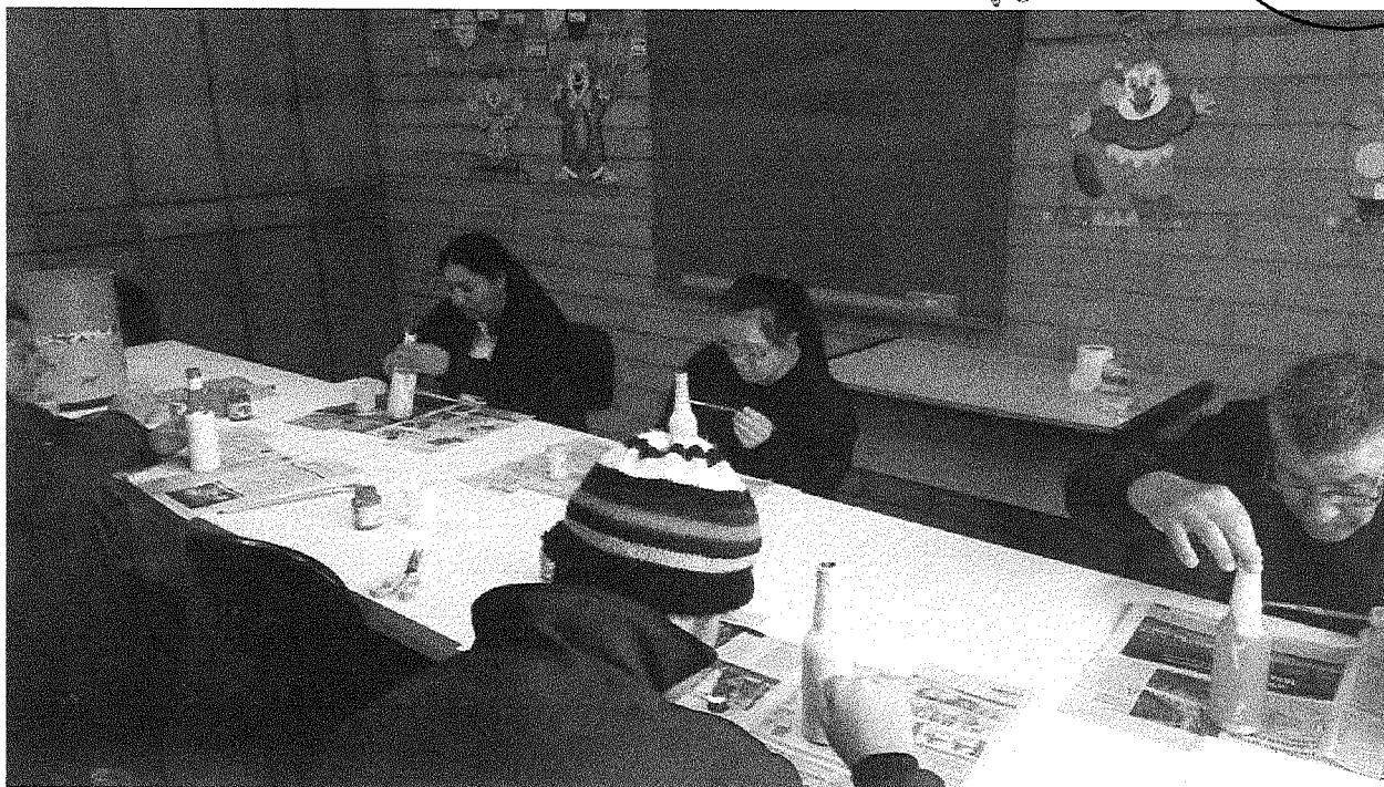
Trabalho de reciclagem em garrafas

APAE - SALTO VELOSO Fls: 100 Assinatura: Reche