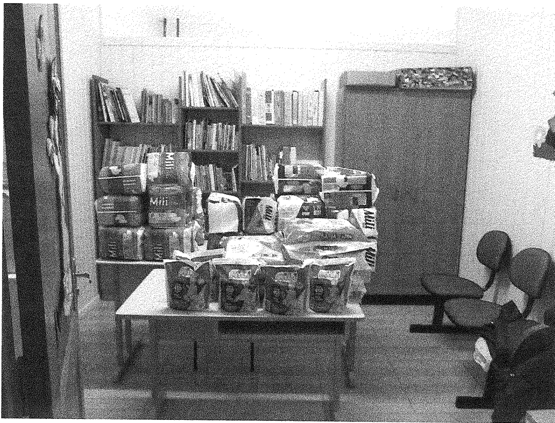
Aquisição de Fraldas e produtos de higiene